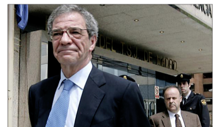
César Alierta, presidente de Telefónica.

RSC. El club de Excelencia en Sostenibilidad presenta en la Casa de América de Madrid la Guía de Movilidad Sostenible para la Empresa Responsable .